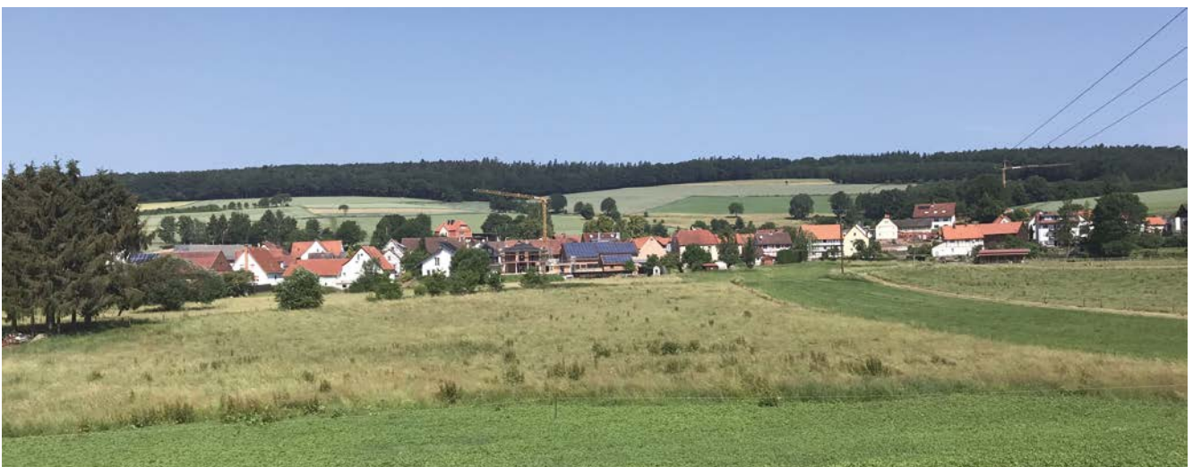
ö Neubaugebiet Kathus

Erklärte Zielsetzung der Dorfentwicklung ist die Lenkung der Investitionen in die Ortskerne. Daher sind grundsätzlich nur Investitionen in den Ortskernen förderfähig. Die Richtlinie sieht für private Vorhaben eine Förderung nur in den abgegrenzten Fördergebieten in den Ortskernen und bei Kulturdenkmälern vor. Im IKEK ist die Fördergebietsabgrenzung für private Antragsteller zu erarbeiten. Sie ist aus der Siedlungsgenese abzuleiten und der Gebietszuschnitt sollte unter strategischen Gesichtspunkten (Lage, Struktur, Funktion und Bedeutung, Lenkung der Fördermittel) festgelegt werden.