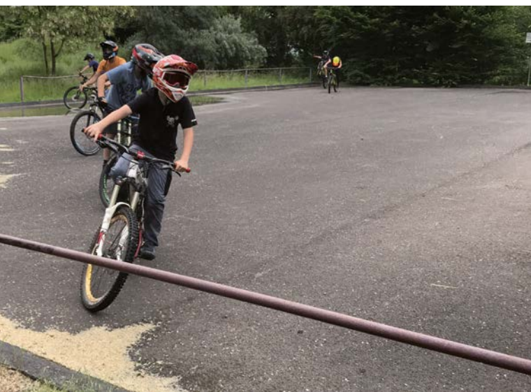
ö Funpark Niederwalgern

Zur Erreichung dieses Programmziels ist eine Auseinandersetzung mit der städtebaulichen Entwicklung ein festes Modul und zentrales Handlungsfeld im IKEK. Grundlage der städtebaulichen Entwicklung ist die Erfassung des bau- und kulturgeschichtlichen Erbes sowie der Innenentwicklungspotentiale (Leerstände, Baulücken usw.) der Ortskerne. Darüber hinaus ist eine Überprüfung der aktuellen Planungen sowie der Zielrichtung der Siedlungsentwicklung erforderlich.