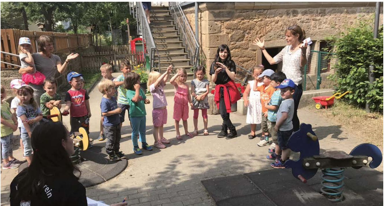
ö Kindergarten Ermschwed

Die Handlungsstrategie baut auf den Ergebnissen der Stärken- und Schwächen-Analyse und den Zielen auf und benennt die daraus abgeleiteten zentralen Handlungsfelder und Vorhaben. Die Handlungsstrategie ist das zentrale Element eines integrierten kommunalen Entwicklungskonzeptes.