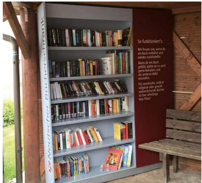
ö Bücherschrank Neutsch

Dezentrale Angebote zur Förderung des lebenslangen Lernens können die Attraktivität als Wohn- und Lebensstandort erhöhen. Sie können ggf. durch bestehende Institutionen oder bürgerschaftliches Engagement ausgebaut werden.