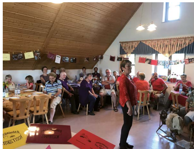
ö Dorfgemeinschaft Poppenhausen

Die Bürgerinnen und Bürger sind auch im Rahmen des IKEK-Prozesses ehrenamtlich zu beteiligen. Es sollte darauf hingewirkt werden, dass diese Mitwirkung an strategischen Fragen nach der Erarbeitung des IKEK fortbesteht. Hierzu sind geeignete Strukturen anzustoßen. Schließlich sollte die Kommune zur Unterstützung eines flexiblen ehrenamtlichen Engagements bei der Kommunikation von Möglichkeiten ehrenamtlichen Engagements tätig werden.