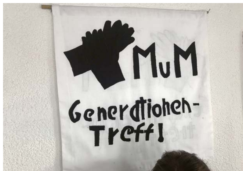
ö Generationentreff Raboldshausen

Der demographische Wandel zeigt insbesondere Auswirkungen in den verschiedenen Bereichen der öffentlichen Daseinsvorsorge. Vor dem Hintergrund einer Sicherstellung gleichwertiger Lebensverhältnisse in den ländlichen Räumen sind die Entwicklungen der sozialen Infrastruktur und Daseinsvorsorge eine wesentliche Aufgabe von Politik und öffent-