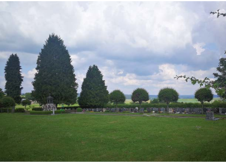
ö Friedhof Fronhausen

Finanzierbaren Maßnahmen im Rahmen der Dorfentwicklung begleitet werden, um das Schrumpfen zu organisieren und die Situation in den ländlichen Räumen insgesamt zu stabilisieren.