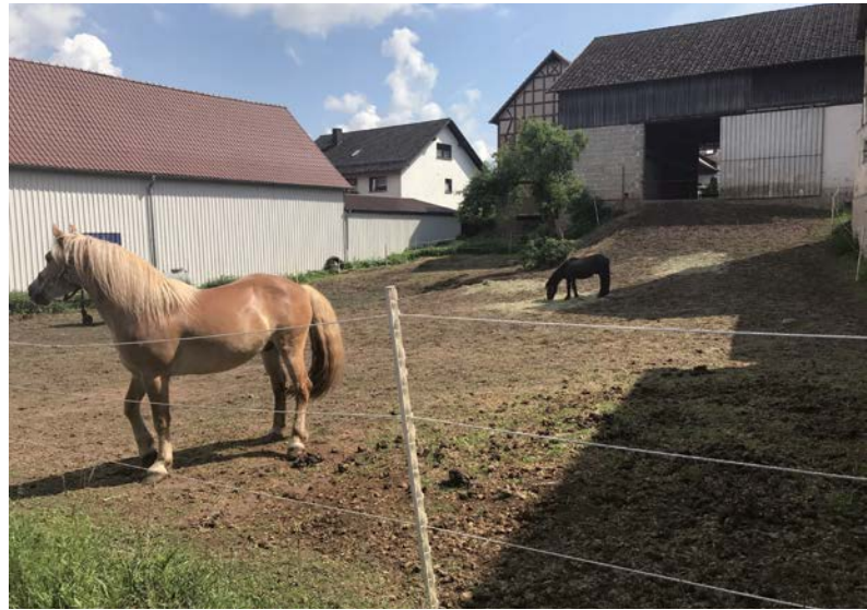
ö Pferdeweide Frohnhausen

Um einer dauerhaften Beeinträchtigung von Ortsbild, Wohnumfeldqualität und Immobilienmarkt entgegenzuwirken, sind nachhaltige Strategien zum Umgang mit Leerstand von Wohngebäuden, Nebengebäuden, Gewerbeimmobilien usw. gefragt. Für die entsprechenden Anpassungserfordernisse müssen Handlungsoptionen für die Ortskerne formuliert werden. Es sind konkrete Aussagen zu den vorhandenen Siedlungsbereichen einschließlich Grünordnung, Gebäuden und Infrastrukturen zu erarbeiten.