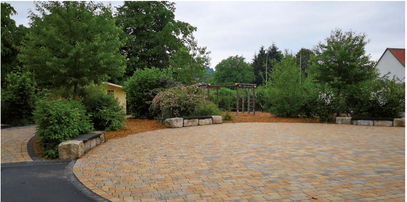
ö Schulhof Ober-Schmitten