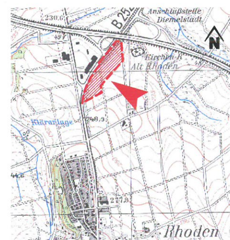
Übersichtskarte (M: 1: 25.000 i.O.)