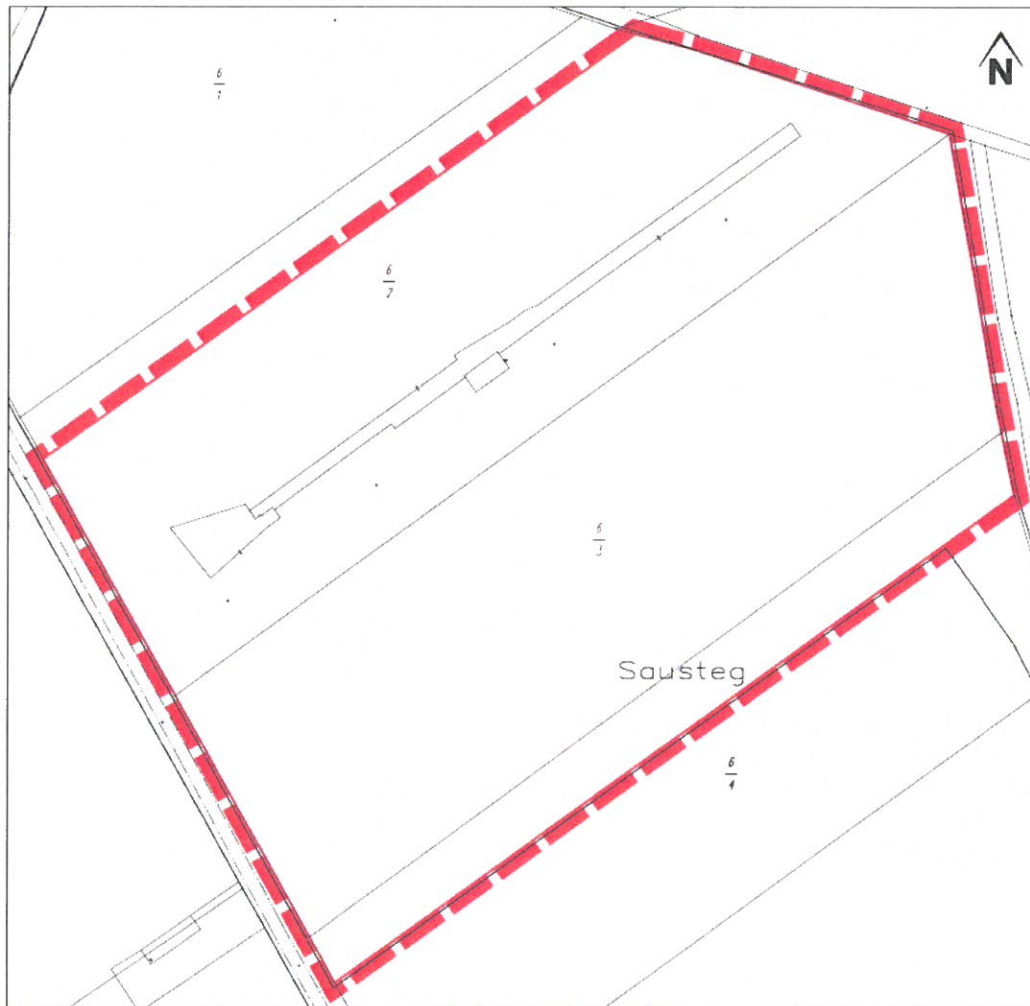
M: 1:1.000 i.O.